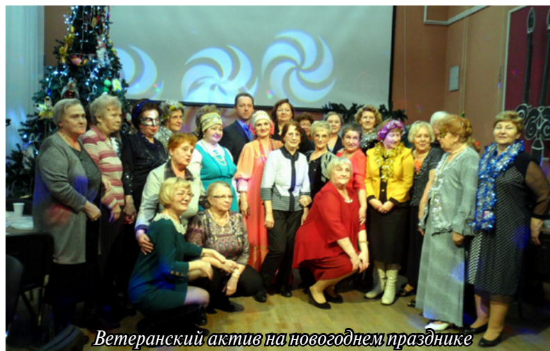
Ветеранский актив на новогоднем празднике