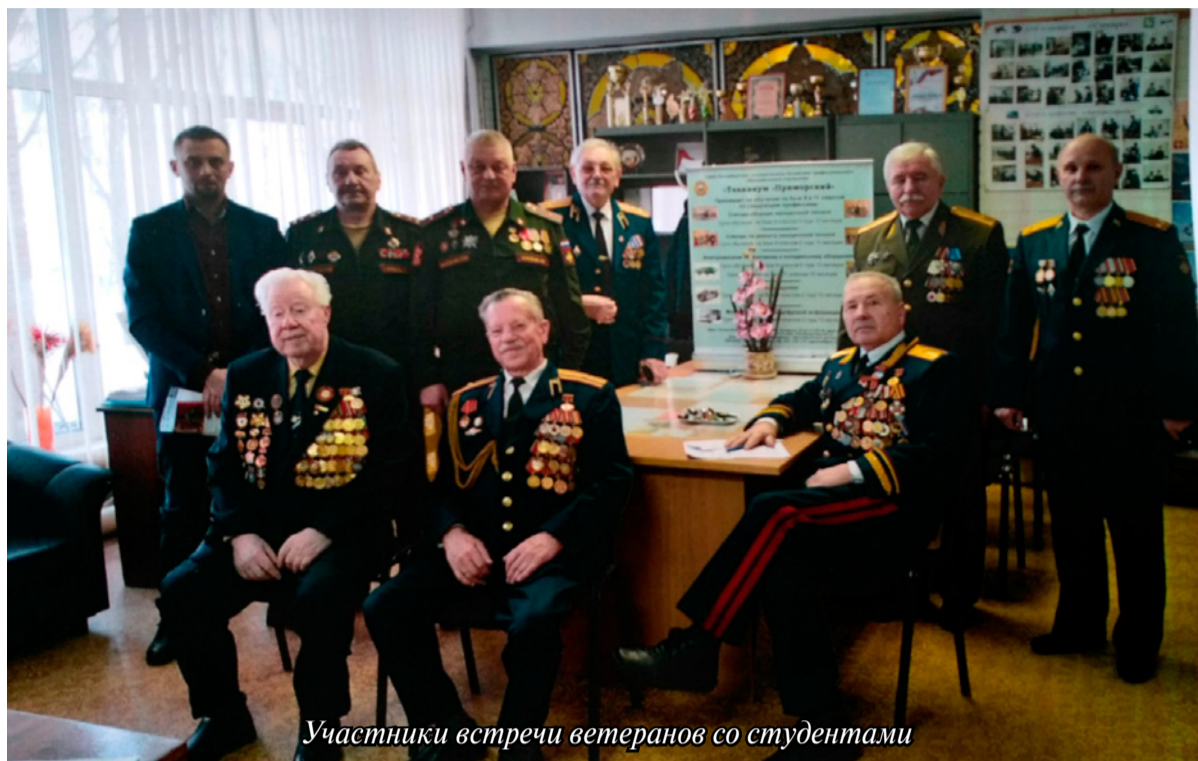
Участники встречи ветеранов со студентами

Горделивой достопримечательностью не только техникума «Приморский», но и всего города является то, что в 1952 году здесь проходила производственную практику (в ПТУ № 24) учащийся Саратовского педагогического индустриального техникума Юрий Алексеевич Гагарин, в качестве мастера производственного обучения. Мемориальная доска