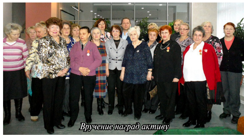
Вручение наград активу

Кроме этих мероприятий ветераны принимали участие в ежемесячных встречах с представителями медучреждений