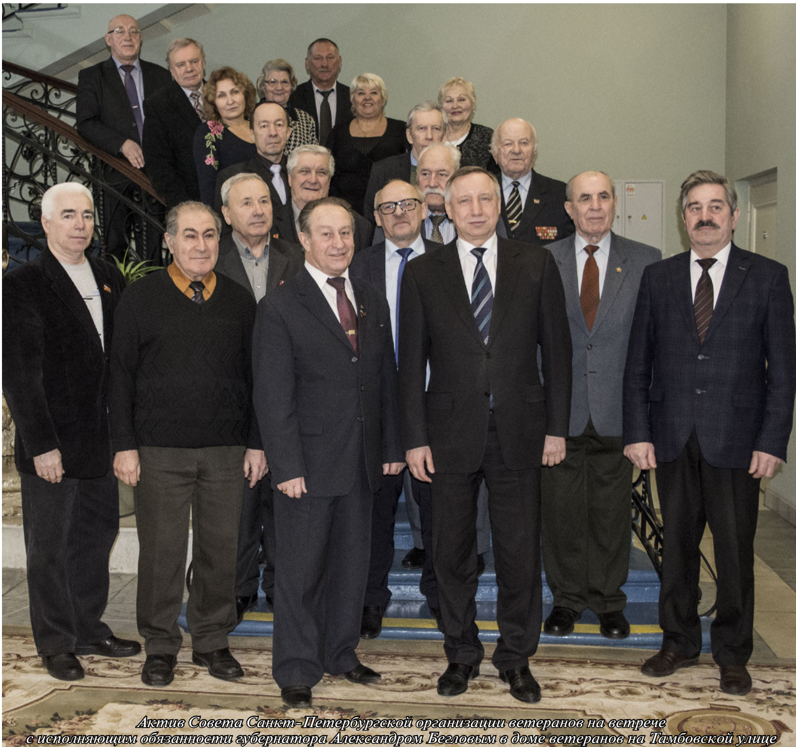
Актив Совета Санкт-Петербургской организации ветеранов на встрече с исполняющим обязанности губернатора Александром Бегловым в доме ветеранов на Тамбовской улице