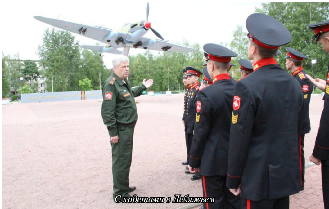
Скадетами в Лебяжье