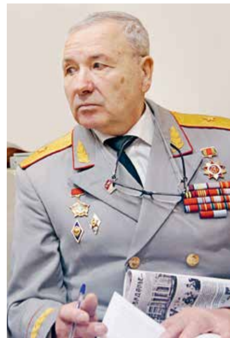
Генерал-майор А. Я. Морозов

До сих пор храню честь генеральского мундира и потому, что он является собой советский покров, на нем в два ряда красуются пуговицы с гербом СССР, серпом и молотом. При разработке новых образцов наград стало модно восхвалять российские дореволюционные награды и другие символы того времени, оставляя без внимания орден Трудового Красного