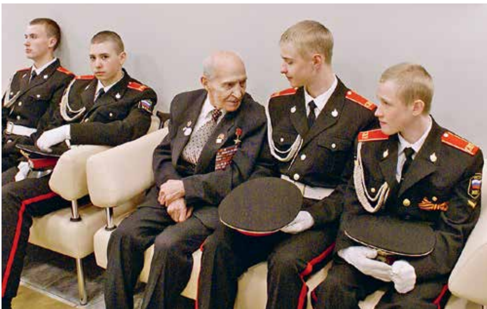
И. Ф. Клочков с суворовцами. 2009 г.

С мая 1984 г. Иван Фролович Клочков в запасе. Избирался народным депутатом СССР (1989-1991 гг.). С 28.03.1987 по 26.11.1992 возглавлял Комитет ветеранов войны Ленинграда и Ленинградской области, с 26.11.1992 по 24.10.1996 — Совет организации ветеранов Санкт-Петербурга.