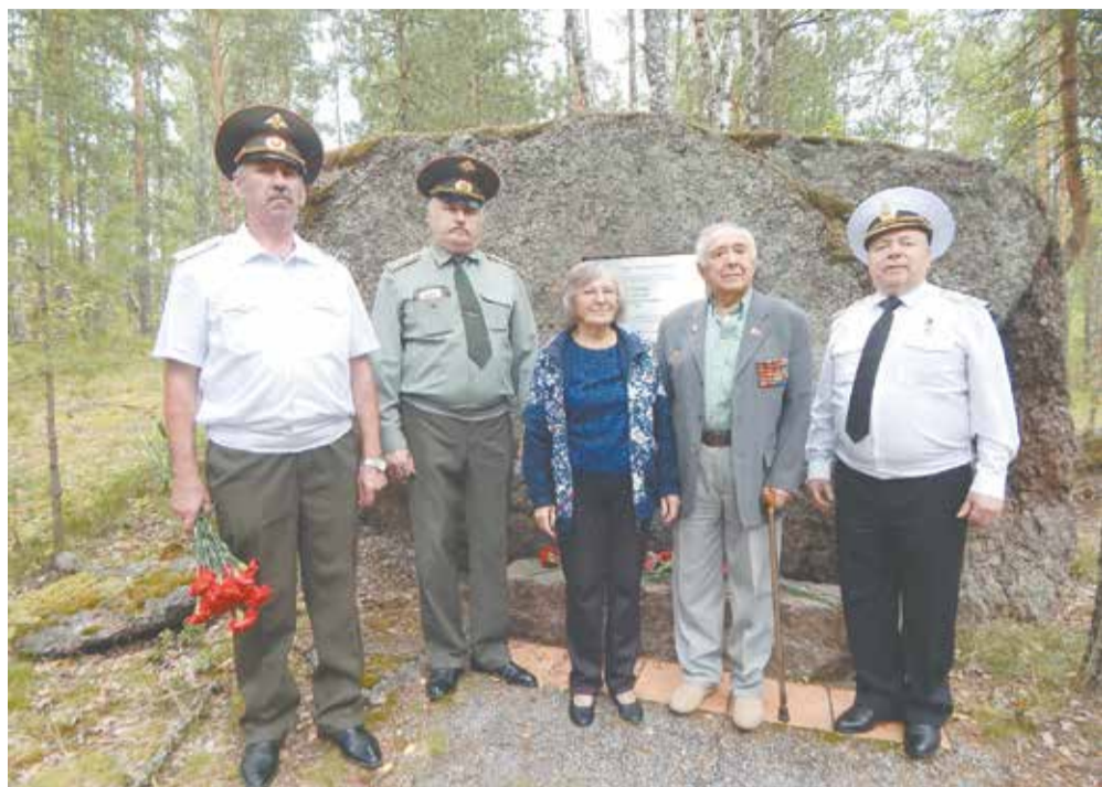
В рамках проекта «Солдаты памяти» в Выборге

В ноябре-декабре началась «глубокая блокада», и мы искали беспризорных брошенных детей по квартирам. На 5-й Советской улице в доме 10 жил известный прозаик Юрий Тынянов. В блокаду его не было, и возле его квартиры, в которой находилась очень ценная библиотека, нам предложили дежурить. Мы поставили у входной двери табуретку и днем, усевшись на нее, по очереди охраняли квартиру. Однажды услышали крик ребенка — стали искать, откуда он доносится. Кстати, тогда входные двери в коммунальные квартиры были открыты. Мы вошли и в одной из комнат застали такую картину: годовалый голодный ребенок пытался сосать молоко из груди умершей матери. Этот случай стал поводом для того, чтобы в каждом районе города были созданы специальные отряды по поиску детей, находившихся в опасности. Несмотря на то что и сами мы тогда были детьми, очень активно ходили по всем дворам. Порой приносили малыша на сборный пункт, забывая, где его взяли. Не всегда догадывались прихватить документы, и тогда в книге, заведенной на сборном