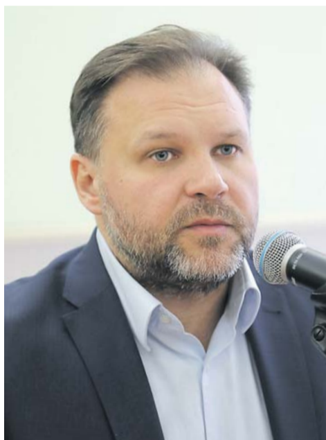
Б. Г. Заставный, председатель Комитета по молодежной политике и взаимодействию с общественными организациями Санкт-Петербурга

По словам В. Т. Волобуева, ветеранским организациям надо как можно активнее работать с Общественной палатой Санкт-Петербурга — в плане подготовки наблюдателей на выборы. Большая роль во время выборной