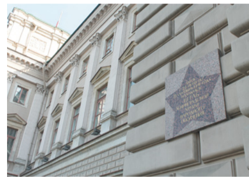
Памятная доска штабу ЛАНО на Маршинском дворце

мурманских. Все, кто давал Клятву ленинградских партизан и воевал в ленинградских партизанских бригадах, в отдельных партизанских формированиях нашего региона, — все наши родные и близки. Мы считаем, все эти бойцы и командиры, что давали Клятву ленинградских партизан, в которой есть такие слова: «Мы защищаем великий город Ленинград и скорей умрем, чем станем на колени, но победим скорее, чем умрем!», достойны вечной памяти ленинградцев.