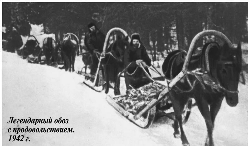
Легендарный обоз с продовольствием. 1942 г.