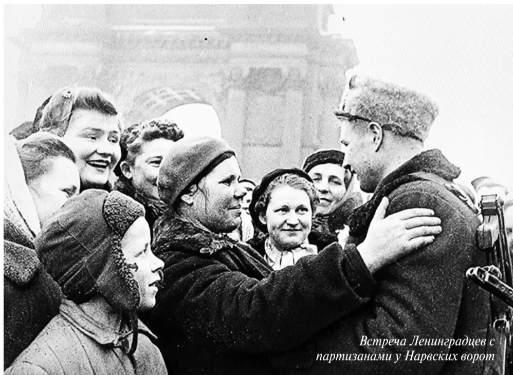
Встреча Ленинградцев с партизанами у Нарвских ворот

— Время неумолимо: из 35 тысяч, числившихся в рядах народных мстителей на 5 марта 1944 года, осталось менее 200 человек. Наш Совет не делит их на псковских и новгородских, тверских и ленинградских, карельских и