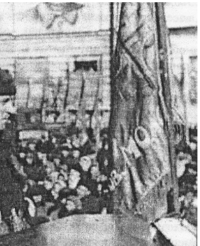
Встреча делегатов партизанского края в полуправлении Северо-Западного фронта в Валдае. 25 марта 1942 г.

отправить его в блокированный город. На том и порешили. <...> В деревню Верхние Нивы, когда уже завершался сельский сход, нагрянули около 200 карателей и стали всех подряд расстреливать из автоматов. 28 человек погибли, в том числе председатель