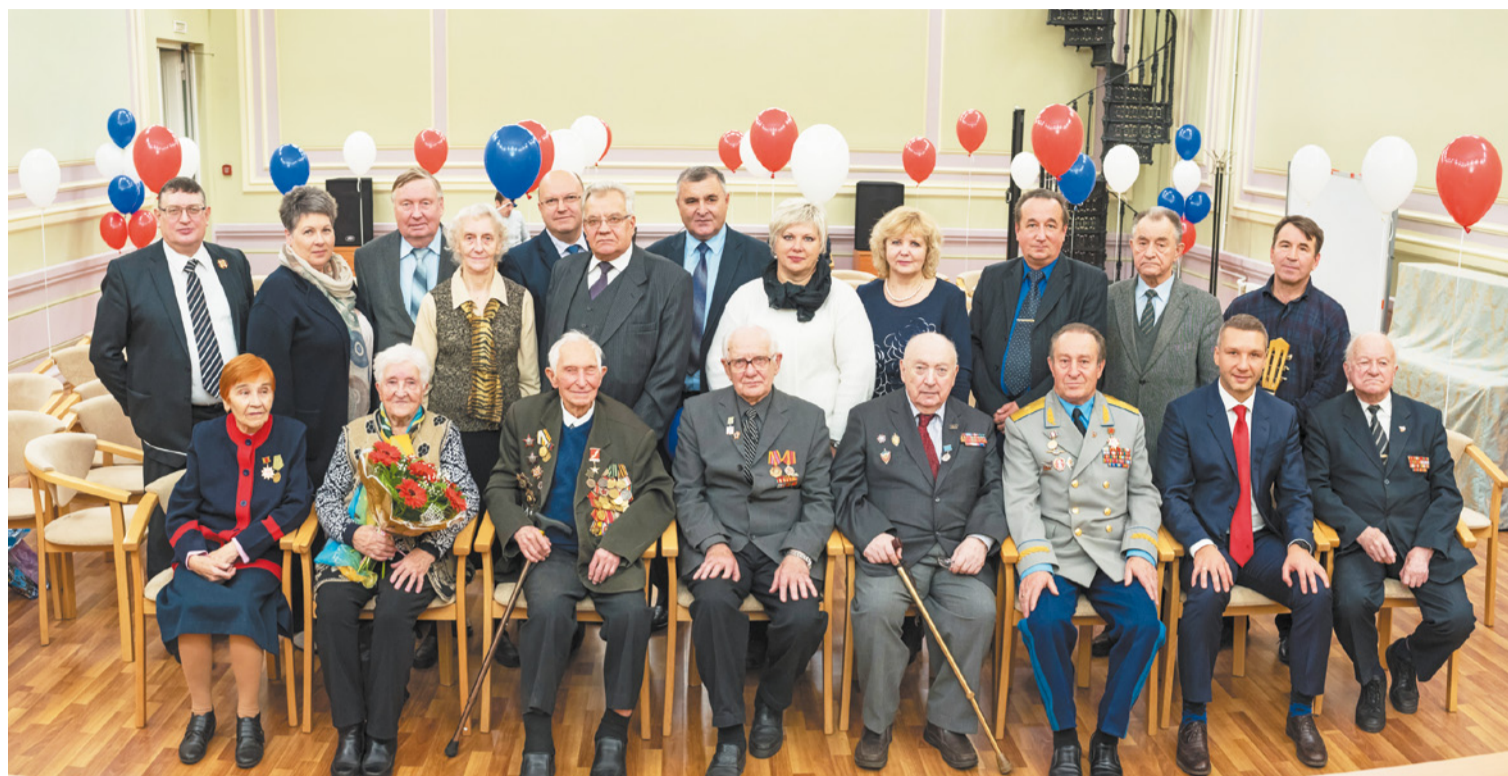
Объединенный совет ветеранов партизанского движения Ленинграда и Ленинградской области (23 октября 2015 г.)