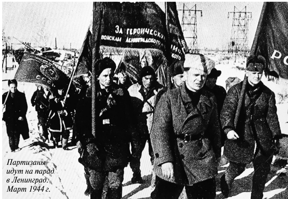
Партизаны идут на парад в Ленинград. Март 1944 г.

За активное участие в общественной жизни Ленинградской области, большую работу по гражданско-патриотическому воспитанию молодежи, создание благоприятной среды для развития межнациональных отношений награжден Почетной грамотой Вице-губернатора Ленинградской области по внутренней политике (2018 г.).