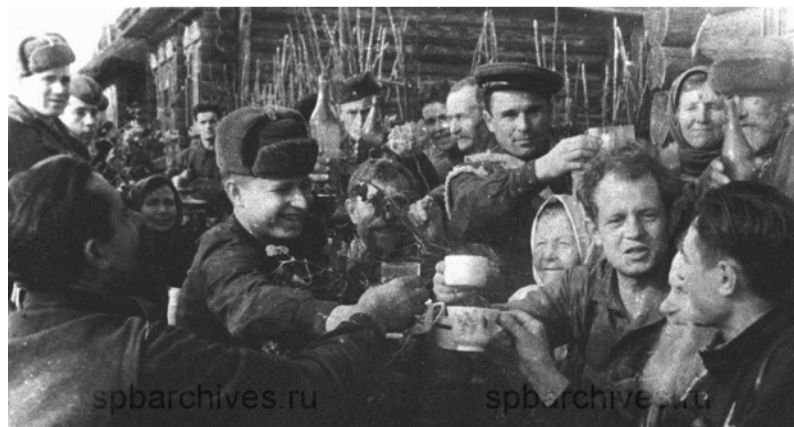
Праздник в деревне, освобожденной от немецкой администрации партизанскими соединениями и восставшими жителями. Осень 1943 г. [д. Бойцово. Порховский район.] Лен. область. Автор снимка В.И. Капустин. ЦГАКФФД СПб. Ар 178336.

В свою очередь, наряду с вещевыми подарками ленинградцев, партизаны получали поддержку от более отдаленных уголков страны, о чем свидетельствуют сохранившиеся фотоснимки делегации из Казахстана.