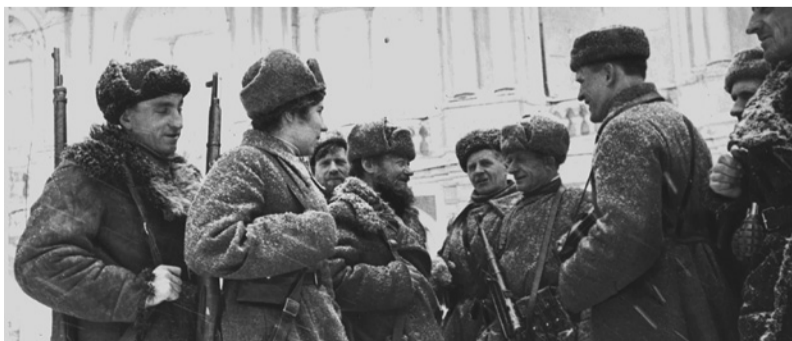
Партизаны, приведшие легендарный обоз в Ленинград, и члены делегации Партизанского края на Дворцовой площади. Третий справа — Герой Советского Союза М.С. Харченко. Апрель 1942 г.