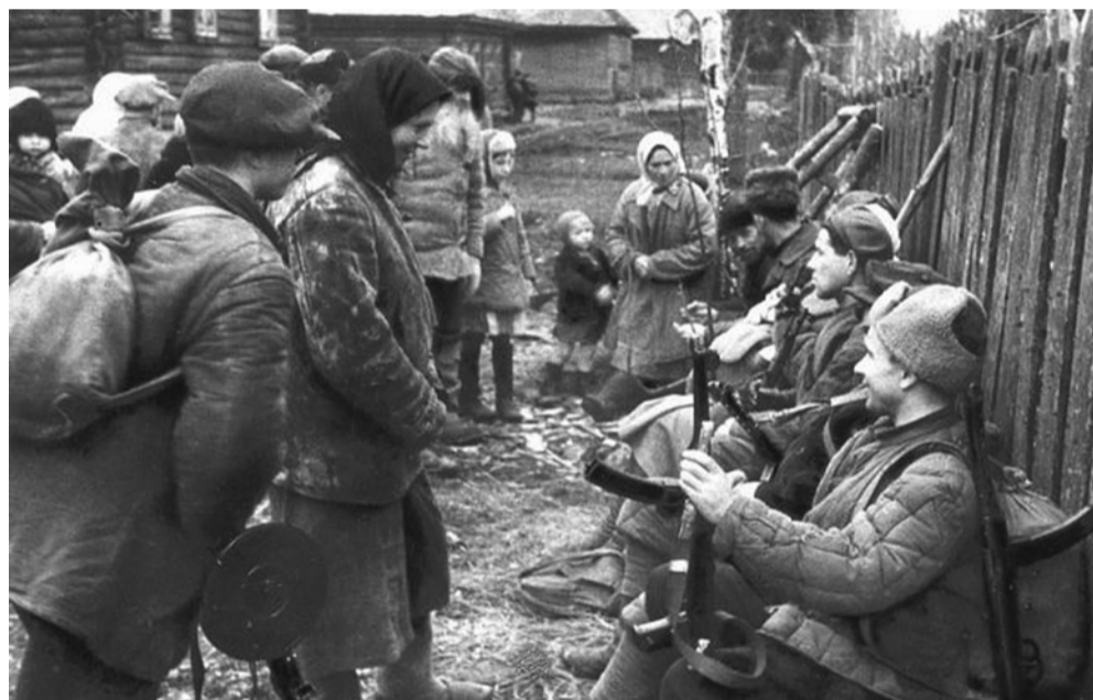
Партизаны на отдыхе

Большую помощь наступающим войскам Красной армии оказывали партизанские соединения. В тылу на коммуникациях 18-й германской армии действовали 2, 5, 6, 7, 9, 10, 11 и 12-я партизанские бригады. Они координировали свои действия с наступающими войсками Ленинградского и Волховского фронтов. 1, 3, 4, 8 и 13-я партизанские бригады находились в тылу 16-й германской армии, в полосе наступления войск 2-го Прибалтийско-