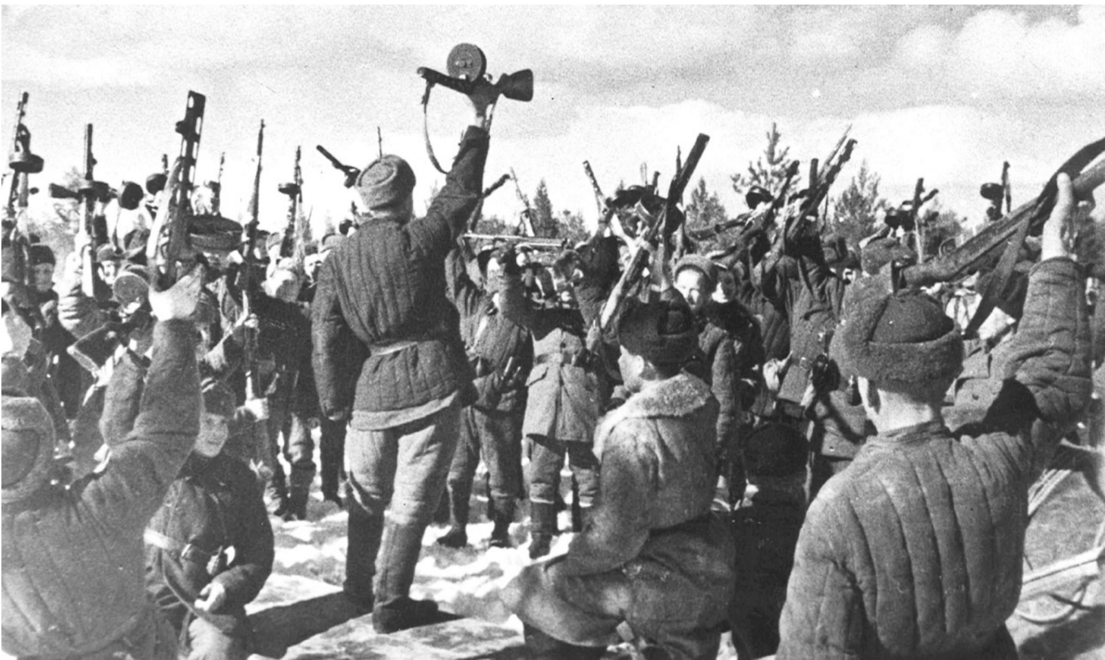
Смерть фашистским захватчиком! Клянутся бойцы 1-го партизанского полка (деревня Морицко, декабрь 1943 г.)

По местам партизанской славы отправились ветераны партизанского движения, школьники и студенты → стр. 12