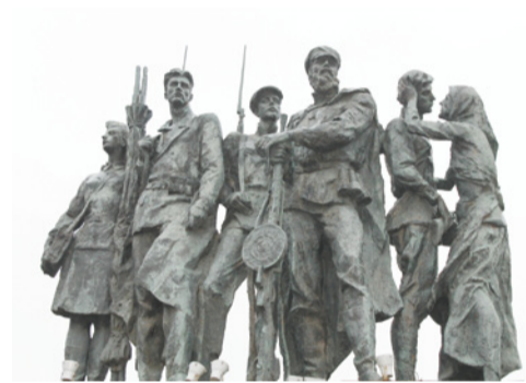
Скульптурная группа, посвященная ленинградским партизанам на Монументе Героическим защитникам Ленинграда