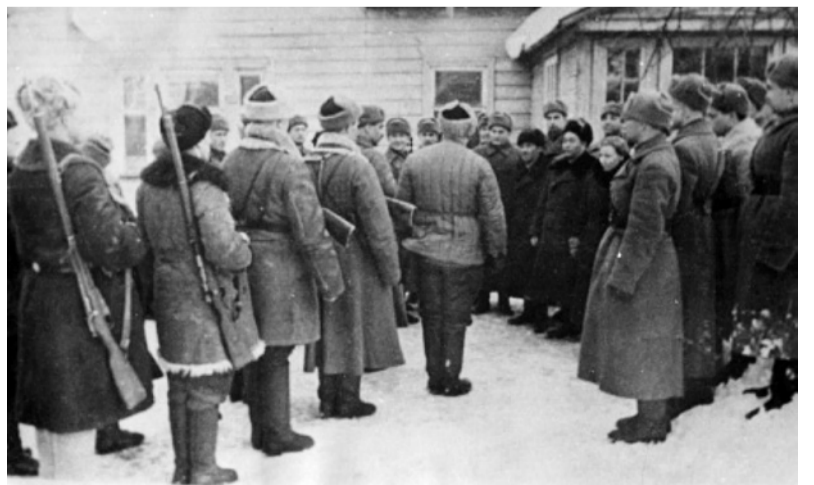
Встреча делегатов партизанского края в полуправлении Северо-Западного фронта в Валдае. 25 марта 1942 г.