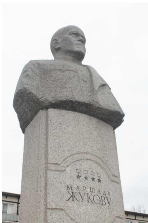
Памятник Маршалу Победы Г.К.Жукову на проспекте Славы