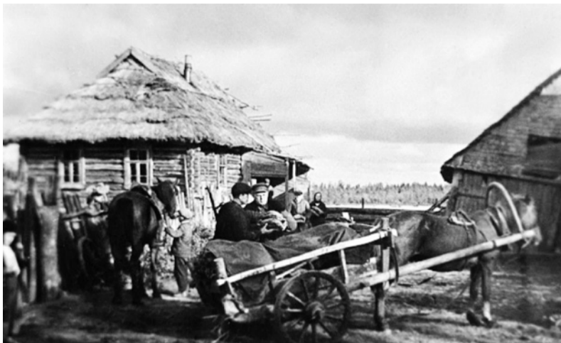
С партизанами делились последним...

Во второй половине пятой ночи пути обоз сосредоточился недалеко от линии фронта, проходившей вдоль шоссе Старая Русса — Холм у деревни Лопари. При подходе к фронту обоз с боем, но без потерь, перешел линию фронта и вышел в распоряжение частей 8-й гвардейской дивизии имени Панфилова.