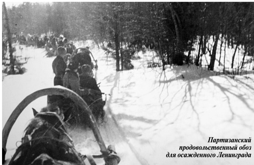
Партизанский продовольственный обоз для осажденного Ленинграда

Надо сказать большое спасибо нашим сельским труженикам оккупированных районов Ленинградской области, которые помогали партизанам и подпольщикам всем, чем могли, — хлебом, одеждой, лечили и укрывали раненых, были про-