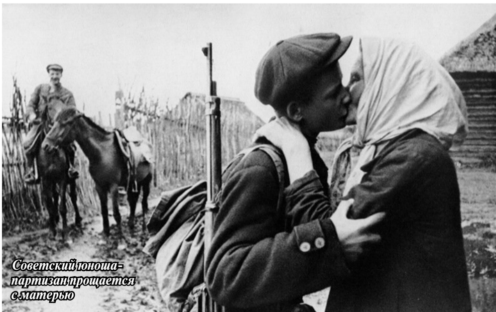
Советский голоща-партизан прощается с матерью